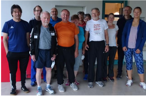
Frühgymnastik. Man achte auf das aufmunternde T –Shirt des Seminarleiters