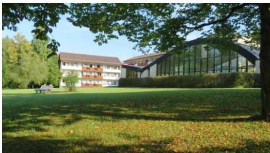
Aura Hotel in Saulgrub

A PS 2021: Geplant – verschoben – mit Verzögerung durchgeführt. Das für 2020 geplante APS konnte aufgrund des behördlich verordneten Lockdowns im Jahr 2020 nicht durchgeführt werden. Die bereits ins Detail gehende Vorbereitung war plötzlich irrelevant, Tristesse machte sich bei dem Organisationsteam um B. Hansel und Dr. P. Zimmer breit. Die zunehmende Durchimpfung gegen das Coronavirus ließ dann im Frühjahr 2021 an eine Wiederaufnahme der Planung denken. Im September war es dann soweit: Eine kleine Gruppe (14 + 6) geimpfter, furchtloser Menschen mit Typ 1 Diabetes, teilweise mit Angehörigen hatten sich für das viertägige Seminar angemeldet.