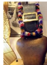
Die Kuhglocke aus dem Aufenthaltsraum in Unterjoch, unser Maskottchen

25. Arzt – Patienten – Seminar. Gemäß dem Motto der letzten Jahre „ Sport, der Spaß macht, Theorie, die das Leben leichter macht und Geselligkeit, die die Lebensqualität erhöht “ war das diesjährige Seminar schwerpunktmäßig den ernährungsbedingten Stoffwechsellurbulenzen gewidmet. Nach dem Mittagessen, das bei herrlichem Spätsommerwetter im Freien stattfand, ging es auf die Tennisfreiplätze. Bei entsprechend dosiertem Spiel mit der Filzkugel kam bei den 23 Teilnehmern aus mehreren Bundesländern (u.a. NRW und Hamburg) schnell eine gute Stimmung auf.